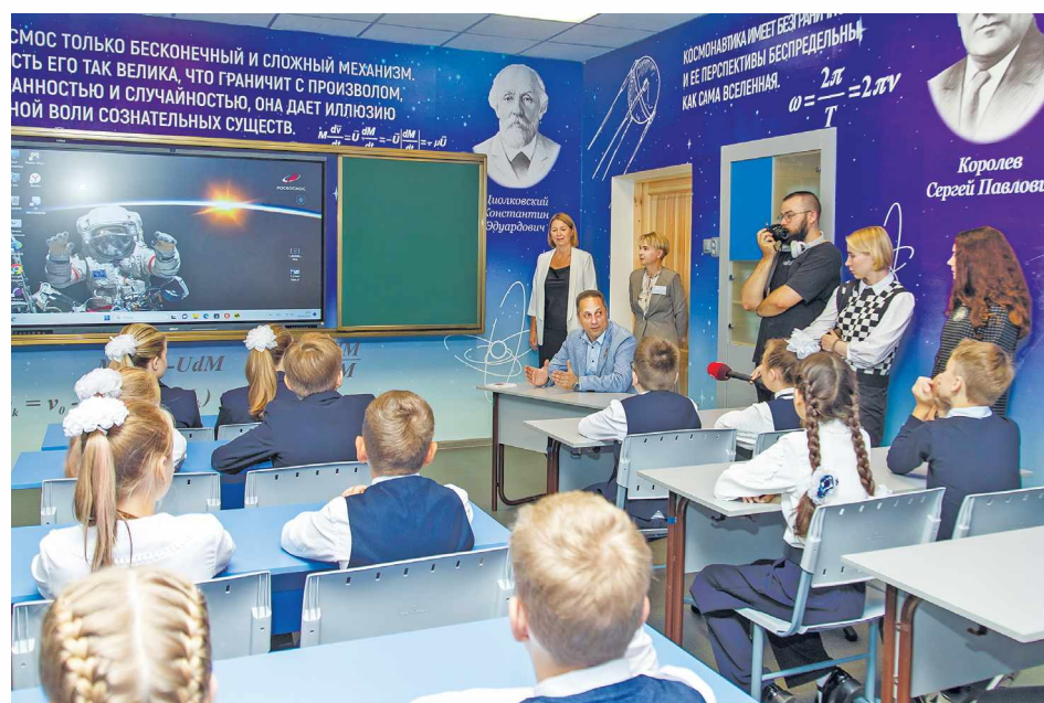
► Антон Шкаплеров на открытом уроке в космокласе школы № 13

Это четвёртый открытый отбор, в котором может участвовать любой гражданин России в возрасте до 35 лет. Новгородская область стала первым регионом, где предварительный этап проходит в виде очных информационных встреч с кандидатами.