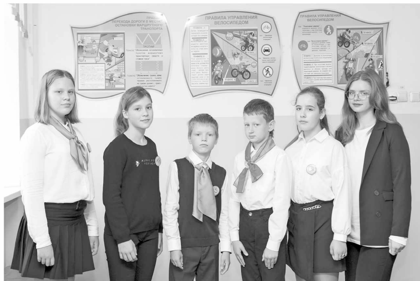
► Кто-то из отряда уже перешёл в лидеры, а кто-то – в наставники