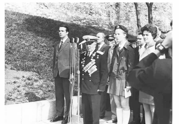
► Открытие Поста № 1 в 1975 году

На основе архивных фото и журналистских материалов активисты Новгородского отделения Союза журналистов России, в основном ветераны журналистики, при партнёрстве редакции газеты «Новгород», комитета по образованию, школы № 14 и городского Совета ветеранов планируют на средства муниципального гранта выпустить фотоальбом, в котором расскажут об истоках патриотической традиции, о том, как было организовано проведение почётной вахты, восстановят самые яркие страницы, а бывшие постовцы поделятся своими воспоминаниями. Часть фотоальбома посвятят возрождению Поста № 1 в наше время. Будет представлено несколько семейных историй о том, как несли вахту в 70-е, 80-е годы, а сейчас в патриотической акции участвуют дети и внуки бывших постовцев. Словом, состоится переключка поколений новгородцев разных лет. Издание будет приурочено к 80-летию освобождения Новгорода от немецко-фашистских захватчиков, которое состоится 20 января 2024 года.