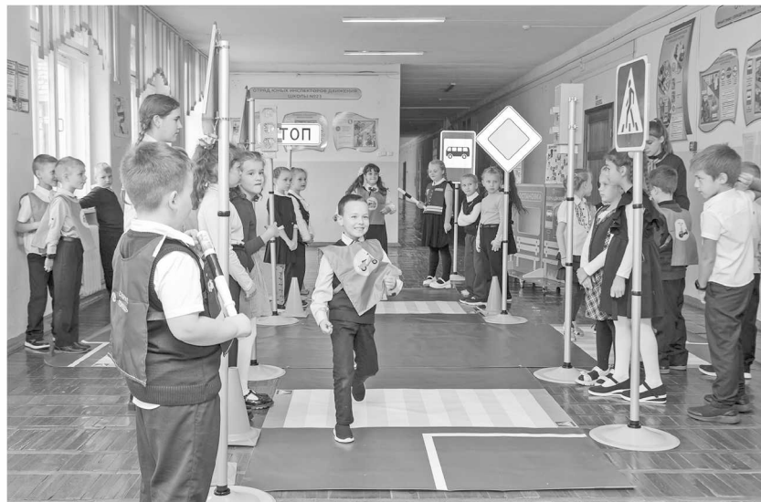
► Благодаря победе в конкурсе «Школьный бюджет» интерактивных занятий у ЮИДовцев теперь больше

А пока у ребят из отряда появилась новая возможность практиковаться – на днях в школу доставили оборудование мобильного автогородка, которое команда приобрела благодаря средствам от победы в городском конкурсе «Школьный бюджет». Перекрёсток, несколько светофоров, дорожные знаки и, конечно, главные атрибуты инспекторов – жезлы и световозвращающие жилеты – всё это позволит ярко и наглядно рассказывать о безопасности на дорогах не только своим сверстникам, но и соседям из детского сада № 8 и начальной школы № 2.