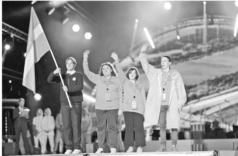
► Команды из 32 регионов России и пяти иностранных государств заявились на участие в чемпионате