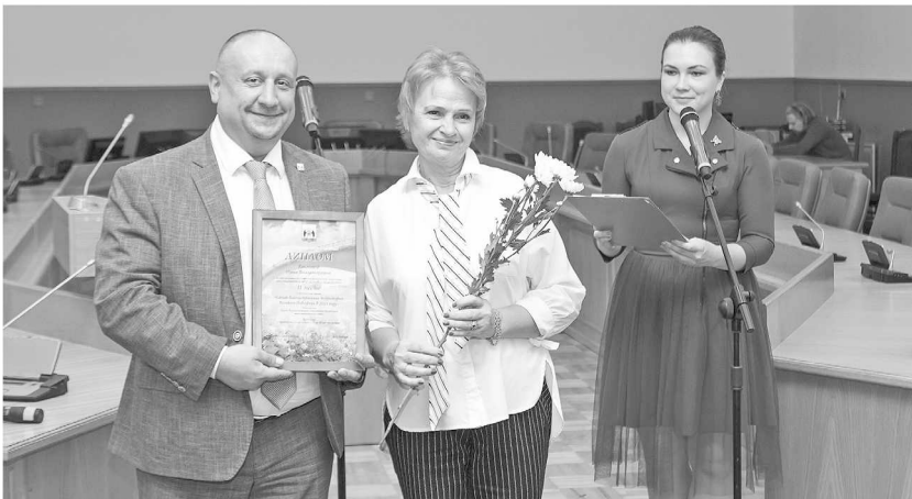
► Награждение победителей конкурса традиционно состоялось в начале осени

В здании администрации Великого Новгорода состоялось торжественное награждение победителей и участников конкурса «Самая благоустроенная территория Великого Новгорода в 2023 году». Отметим, в конкурсе участвовали как отдельные жители, так и организации.