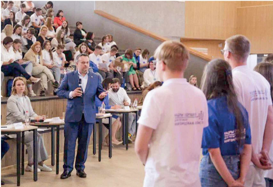
► Концепция «Город-университет» включена в стратегию социально-экономического развития Новгородской области

За год до смерти Пётр Великий распорядился посадить на Карельском перешейке корабельную рощу, которая в будущем должна была стать источником первоклассного материала для кронштадтских верфей. Тогда же, в 1724-м, император издал указ об основании Санкт-Петербургского университета. Лиственницы растут долго – несколько столетий, и в середине XIX века начавшаяся эра железных паровозов поставила крест на задумке императора. Но в год, когда, по планам Петра, в Линдуловской роще должна была начаться рубка первых деревьев, на кронштадтском рейде бросил якорь первый в мире арктический ледокол «Ермак», над концепцией которого работал выпускник и профессор Санкт-Петербургского университета Дмитрий Менделеев.