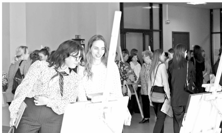
▶ На фотовыставке представлены настоящие зарисовки из жизни педагогов

Сразу несколькими яркими нотами ознаменовалось открытие в региональной столице X Форума молодых педагогов. Нынешняя, юбилейная встреча тех, кто зажигает в детских глазах огонёк интереса к многообразному миру познаний, носит название «Молодой педагог – педагог будущего». За три дня новым лицам в этой благородной профессии предстоит почерпнуть и поделиться множеством ценных знаний и практик.