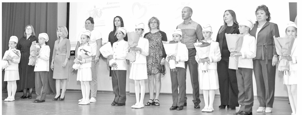
▶ Каждому из профессионалов ученики торжественно вручили цветы

После состоялось награждение победителей муниципального этапа областного конкурса педагогического мастерства – 2023. Оно прошло в формате настоящего парада: вышедшие вместе с педагогами на сцену их воспитанники торжественно вручили цветы своим наставникам.