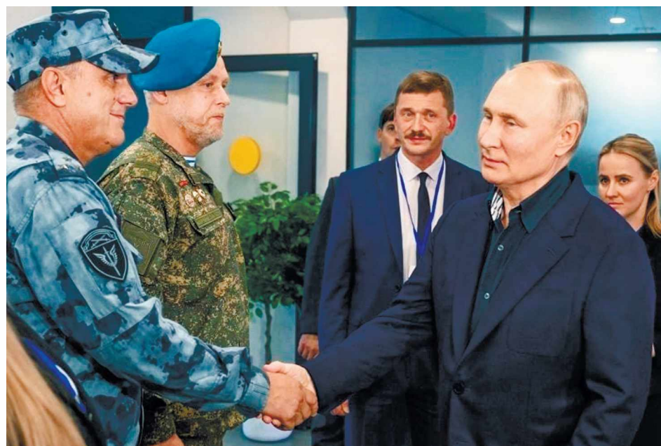
▶ В Центре помощи и поддержки ветеранов СВО и их семей «Возвращение» Владимир Путин пообщался с ветеранами специальной военной операции

Как прозвучало на заседании, задача на текущее десятилетие – переход к экономике высоких заработных плат. Как отметил Владимир Путин, нужно обеспечить возможность гражданам повышать свою квалификацию, осваивать