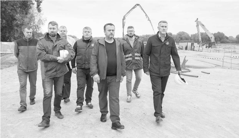
► Губернатор отметил, что пешеходный маршрут по набережной должен быть продлён до места, где планируется строительство канатной дороги

ДО КОНЦА ОКТЯБРЯ НА НАБЕРЕЖНОЙ АЛЕКСАНДРА НЕВСКОГО ЗАВЕРШАТСЯ ОСНОВНЫЕ СТРОИТЕЛЬНЫЕ РАБОТЫ