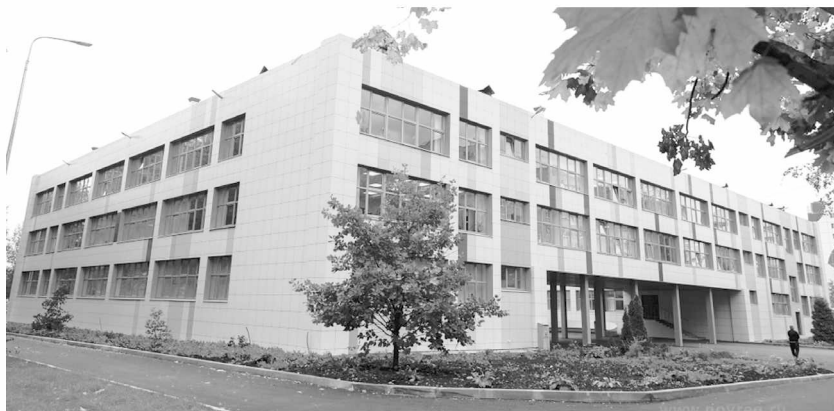
► К середине ноября оба корпуса гимназии «Исток» приобретут единый современный вид

Губернатор подчеркнул, что после завершения благоустройства этих объектов надо найти решения для продления пешеходного маршрута до места, где планируется построить канатную дорогу, чтобы люди могли гулять по городу с комфортом.