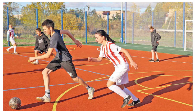
► В течение последних двух лет в Новгородской области уделяли повышенное внимание развитию школьного и студенческого спорта

Минспорт планирует расширить географию участников соревнований, которые проводят в области. В Боровичах уже состоялся всероссийский турнир «Кубок городов трудовой доблести» по самбо, а статус автомобильного ралли «Суворов» в Любытинском районе и Хвойнинском округе вырос до этапа чемпионата России. В Мошенском в 2023 году впервые прошёл региональный фестиваль сверхлёгкой авиации. Он станет ежегодным.