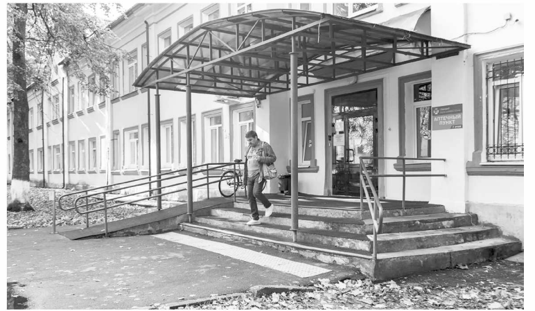
► Поликлиника № 1 открылась в Новгороде 13 октября 1948 года

Считает, даже когда всё плохо, важно не терять оптимизм, с позитивом ко всему относиться – это тоже в определённом смысле лекарство. А ему самому ещё помогают книги.