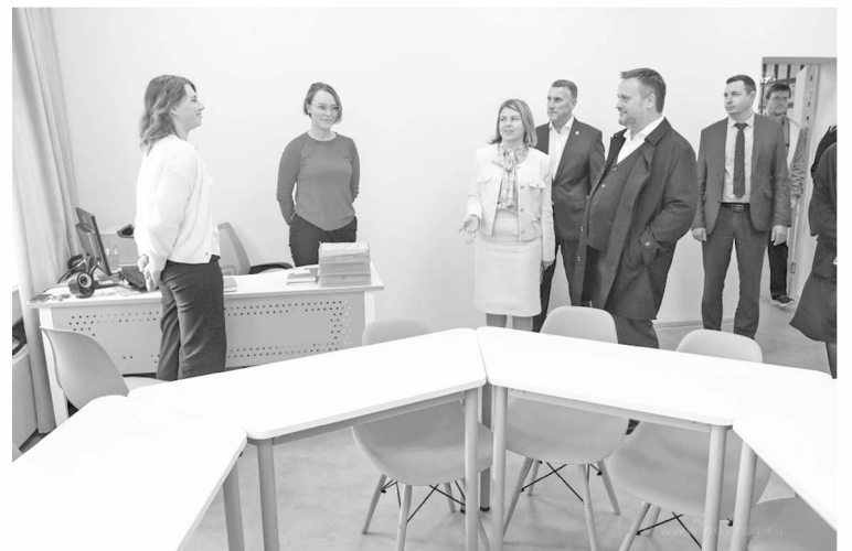
► В лицее отремонтированы все кабинеты и коридоры, закуплены новая мебель и оборудование

– Президентская программа по ремонту школ продолжается, и минимум 12 учреждений в регионе попадут в неё на следующий год. В рамках программы «Развитие образования» федеральные деньги направляются только на ремонт зданий. Для лицей мы добавили дополнительные средства на благоустройство. Я считаю, что если мы делаем красивую современную школу, то должны обеспечить