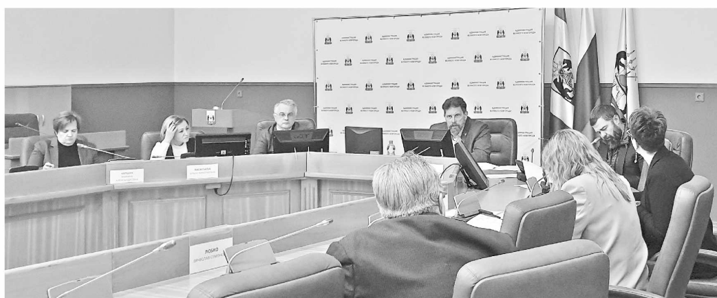
▶ На первом заседании конкурсная комиссия рассмотрела 15 заявок участников