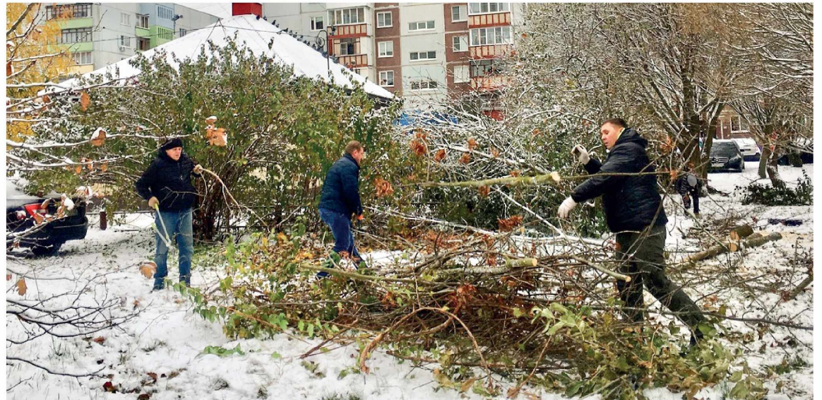
► В сквере подрезали разросшуюся поросль и удалили мешающие растения. Затем их измельчат для удобрения почвы

– В сквере «Минутка» субботник состоялся вот в таком альтернативном формате: как уже сказали, подрезкой