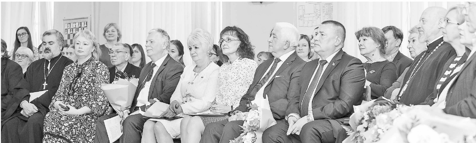
► Почётные гости высоко оценивают вклад школы в духовно-нравственную составляющую образования в Великом Новгороде