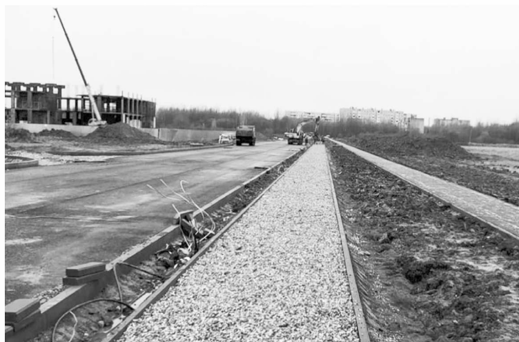
► Идёт строительство недостающего участка улицы Королёва

! Доля городских автомобильных дорог в нормативном состоянии на конец года составит 78 %.