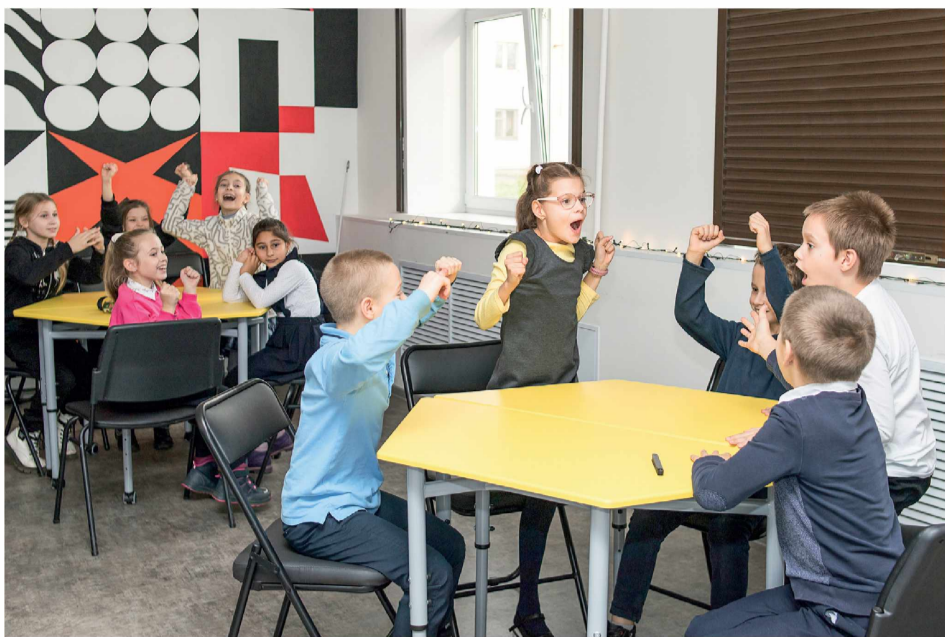
► В библиотеке можно не только читать, но и играть