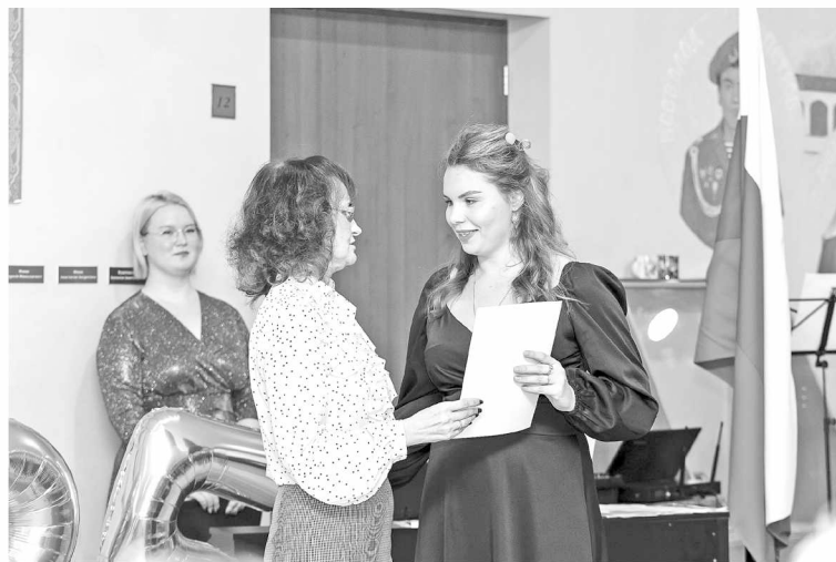
► Началась праздничная встреча в стенах 20-й школы с поздравлений

Хотя школа № 20 сравнительно молода, самому зданию более полувека. Оно построено в 1959–1960 годах и до 90-х здесь располагалась школа № 6. Затем произошла реорганизация, и 6-я «переехала», уступив в 1998 году место школе новой. И вместе с тем, как показали 25 лет её жизни, – новому духовно-нравственному образовательному проекту. Особое внимание,