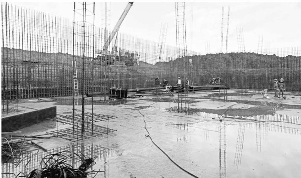
► Бетонирование стен резервуара выполнено более чем наполовину

Строительство ведётся по федеральному проекту «Жильё» и региональному проекту «Жильё и ипотека» в рамках государственной программы Новгородской области «Развитие жилищного строительства на территории Новгородской области на 2019–2025 годы» в рамках реализации нацпроекта «Жильё и городская среда».