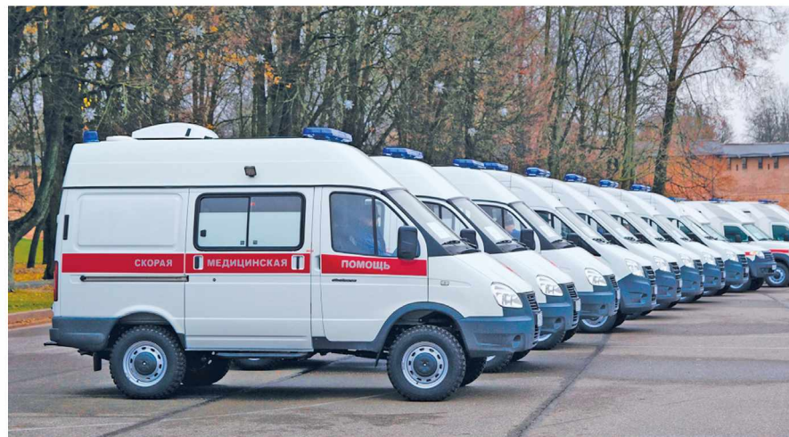
▶ Четыре новых автомобиля скорой помощи предназначены для Великого Новгорода

Четыре новых автомобиля останутся в Великом Новгороде, два передадут в Боровичи и по одному – в деревню Пятилицы, на железнодорожную станцию Уторгош, в Малую Вишеру, Окуловку и Хвойную. Все они оснащены необходимым медицинским оборудованием и предназначены для проведения лечебных мероприятий скорой помощи силами врачебной бригады, для транспортировки и мониторинга состояния пациентов на догоспитальном этапе.