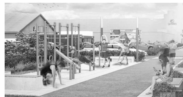
► Пешеходная зона улицы Попова (проект)

В парке «Деревяницкий» планируется выполнить устройство велодорожки и видеонаблюдения (восемь камер) вдоль центральной аллеи (1 850 кв. м). Стоимость благоустройства – 9 млн рублей.