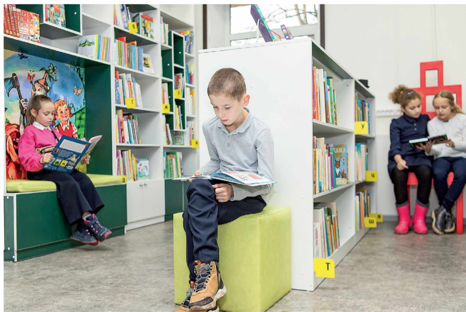
► Главное богатство библиотеки – книги, их в фонде насчитывается около 36 тысяч