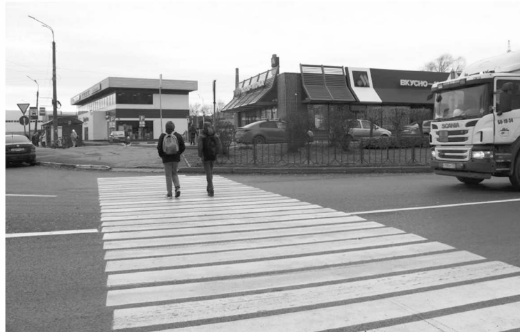
► Завершён ремонт участка Сырковского шоссе

Добавим, что, кроме ремонтных работ, в рамках нацпроекта «Безопасные качественные дороги» в текущем году осуществляются строительство, реконструкция и капитальный ремонт автомобильных дорог общего пользования по следующим объектам: