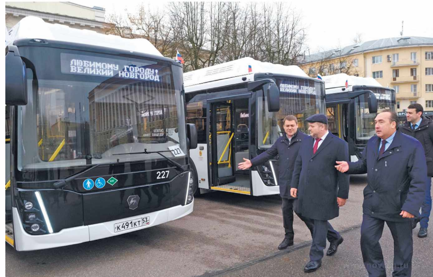
▶ Новые автобусы работают на экологически чистом топливе – метане. Они будут обслуживать маршруты Великого Новгорода