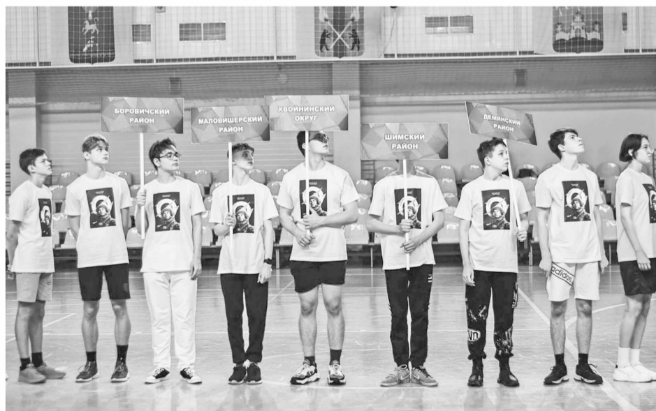
► Участниками первого этапа стали 2 227 школьников и студентов Новгородской области. Из них только 50 прошли во второй этап

Олимпиада проводилась правительством Новгородской области совместно с государственной корпорацией «Роскосмос» в рамках приоритетного регионального проекта «Космическая олимпиада».