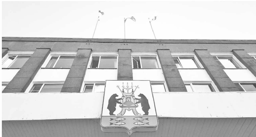
До 28 ноября члены думских комиссий детально проработают проект городской казны

– Структура бюджета по доходам и расходам осталась прежней. Доходы на 2024 год учтены в сумме 3 миллиарда 321 миллион рублей. Помимо этого, доходы также предполагают безвозмездные поступления в виде субсидий, субвенций и иных межбюджетных трансфертов на общую сумму 4 миллиарда 100 миллионов рублей. Также 18 миллионов предполагается от ПАО «Акрон». Объем расходов бюджета в части собственных полномочий запланирован на сумму 3 миллиарда 656 миллионов рублей, – разъяснила Елена МЕДЕВЕВА.