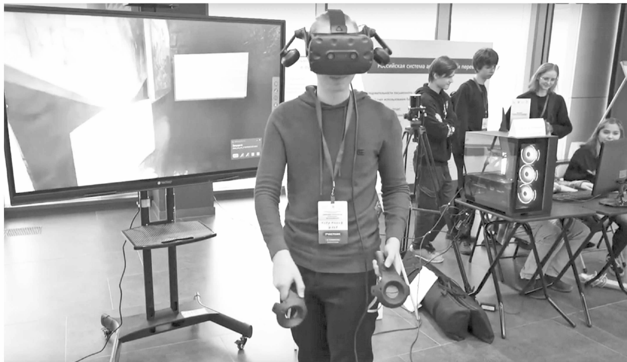
► Конгресс молодых учёных Новгородской области будет проводиться ежегодно

АНДРЕЙ НИКИТИН ПОДДЕРЖАЛ НОВГОРОДСКИЕ СТАРТАПЫ НА КОНГРЕССЕ МОЛОДЫХ УЧЁНЫХ