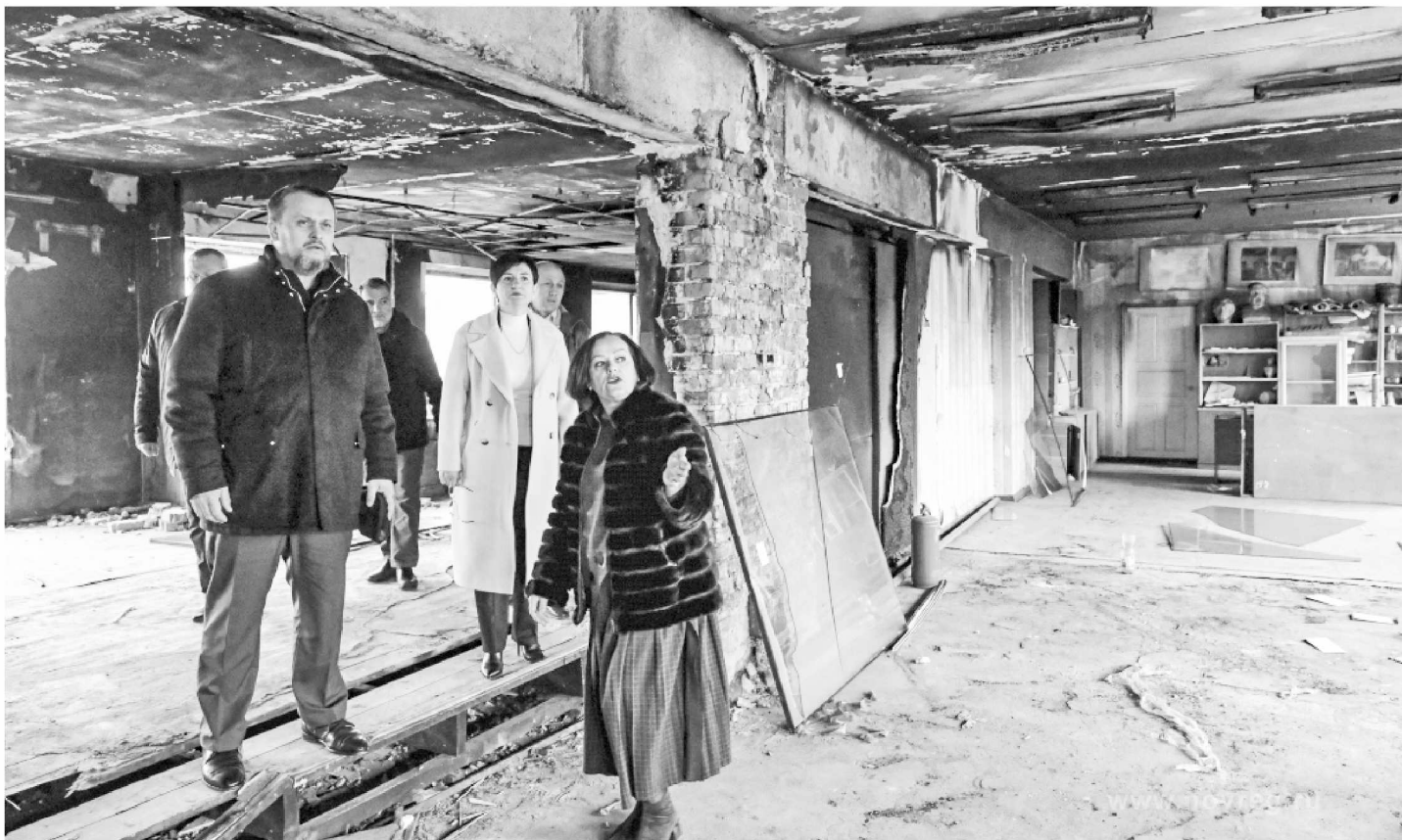
► Андрей Никитин сообщил, что план оказания помощи подшефным территориям на 2024 год согласован

ГУБЕРНАТОР НОВГОРОДСКОЙ ОБЛАСТИ АНДРЕЙ НИКИТИН В ОЧЕРЕДНОЙ РАЗ ПОСЕТИЛ ПОДШЕФНЫЕ ТЕРРИТОРИИ ЗАПОРОЖСКОЙ ОБЛАСТИ