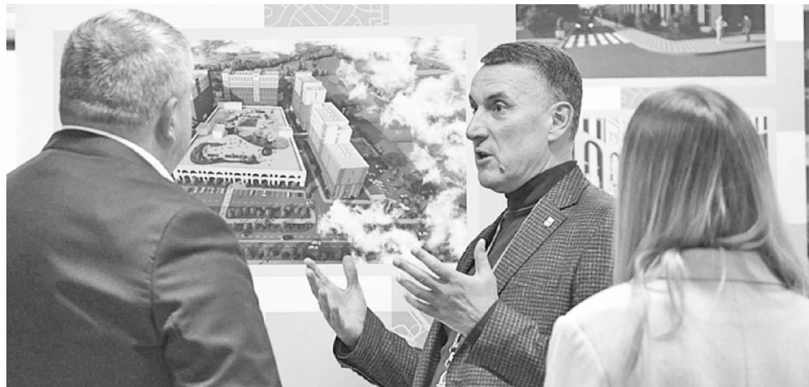
▶ По словам мэра, сегодня необходимо увеличить количество мест, где молодёжь могла бы реализовать свои способности и таланты

– Более 40 гектаров территории в центре города, по сути, превращаются в университетский микрорайон благодаря плановой работе губернатора, правительства, команды Великого Новгорода, – отметил он. – В рамках работы по проекту «Город-университет» мы привлекли наших коллег из Высшей школы экономики для проведения социологического исследования. 95 % жителей поддерживают идею города-университета. Исследование показало группы горожан, которые имеют наибольшее влияние на продвижение концепции. Это педагоги и родители школьников. В 2024 году пройдёт такое же иссле-