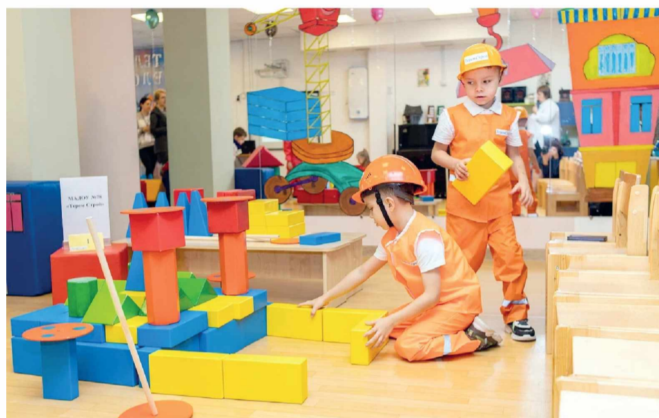
► За 25 минут строительной бригаде предстояло возвести сооружение в соответствии с «техническим заданием»: кому-то выпал дворец спорта, кому-то — театр, а третьим — замок с крепостью

— В следующем году мы планируем расширяться и по составу участников — включать в компетенцию ещё и этап для младших школьников, и по составу партнёров. Наш сад — стажировочная площадка лаборатории детских проектов «Молекула», в дальнейшем мы хотим сотрудничать со строительным колледжем, куда дети смогут