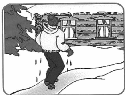
Не отдышая, бежать к близкому жилью