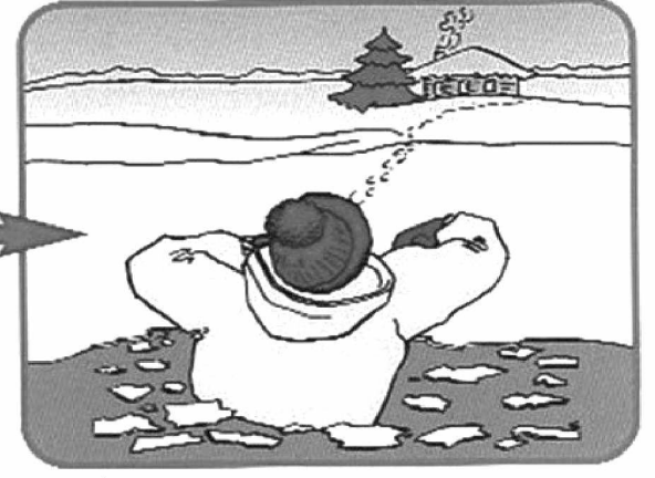
Выбираться в сторону, с которой произошло падение