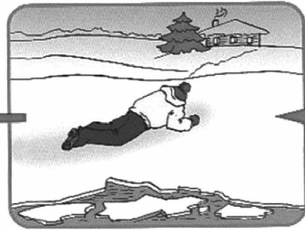
Проползти 3-4 метра по своим следам