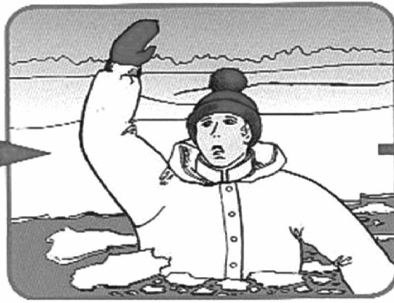
Не паниковать, позвать на помощь