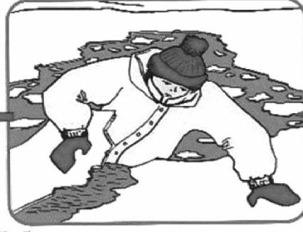
Забросить на лёд ногу, откатиться от полыньи